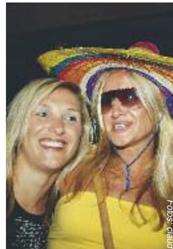
Gut gelaunte Partygirls