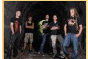
Dread The Moment

Für die Jugendkulturhalle frei:raum in der Herzogenburgerstraße hat die Herbstsaison begonnen. Der elektronische Club Neigungsgruppe Plattenspiel macht den Anfang. Eine Woche später sind dann die Hard Sessions an der Reihe und lassen die Herzen aller Fans von Techno höher schlagen. Spät feiert der Klub Vorsicht sein offizielles Ende. Wegen eines Wasserrohrbruchs musste der Veranstaltungsort in der Bräuhausgasse aufgegeben werden. Den frei:raum werden die alten Hasen Rob STP, Haze, Meph und noch viele mehr beschallen.