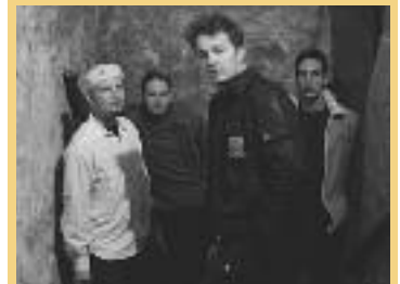
The Blinded Colours

Von 19. bis 20. September findet zum zweiten Mal das St. Pöltner Metal Weekend statt. Unter dem Namen „Tales from a Moshpit“ vereinigen sich Schwermetaller aus ganz Österreich. Live on stage sind diesmal die Bands Desiccated, Darkfall, Darkside, Devanic, Third Moon, Shadowcry, In Slumber, Dread The Moment, Perishing Mankind, Epsilon, Mitigate und Trashcanned.